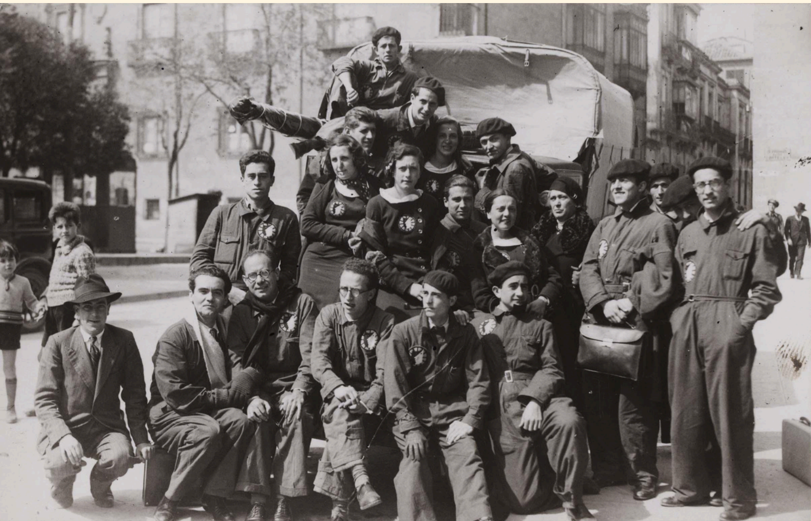
Miembros de La Barraca (1933), Museo Nacional Centro de Arte Reina Sofía, Madrid, España

Las ideas fundamentales de La Barraca perduraron durante la dictadura, cuando se crearon otros grupos de teatro para fascistizar a la población a la que alcanzaban. Hoy en día, el impacto que La Barraca tuvo en una sociedad española muy atrasada y analfabeta es innegable y representa un hito en llevar el teatro al pueblo y la experiencia de vivirlo directamente.